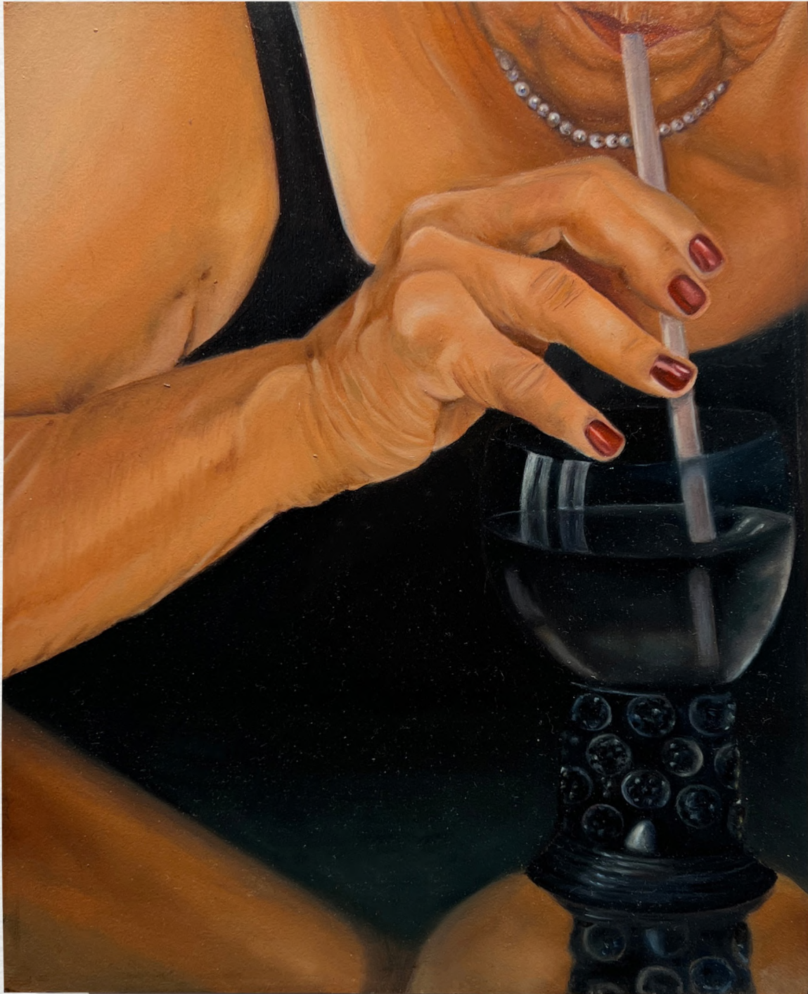
Later , 2023 Oil on Wood 19 x 24 cm