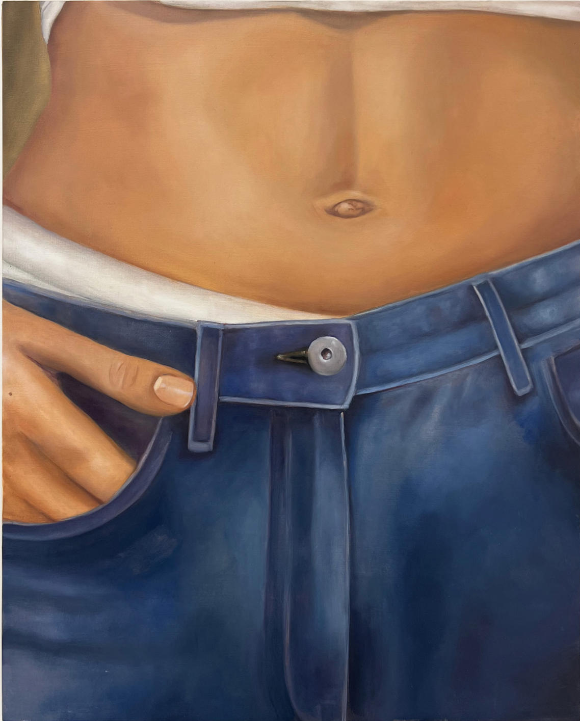
Belly , 2023 Oil on Wood 33 x 40 cm