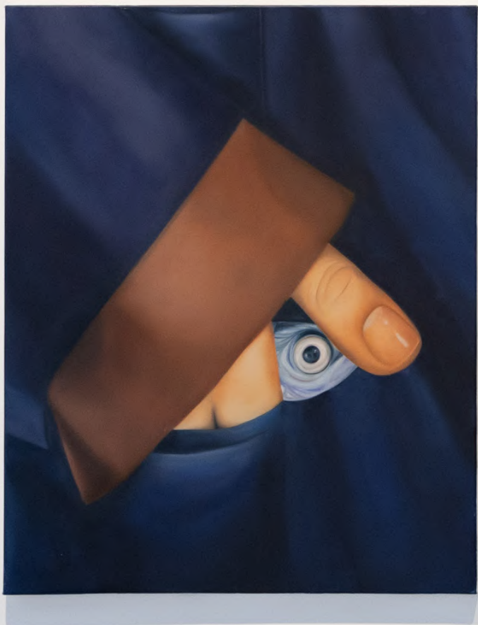
Scheveingse Schildersgilde, Huile sur Toile 65 x 81 cm