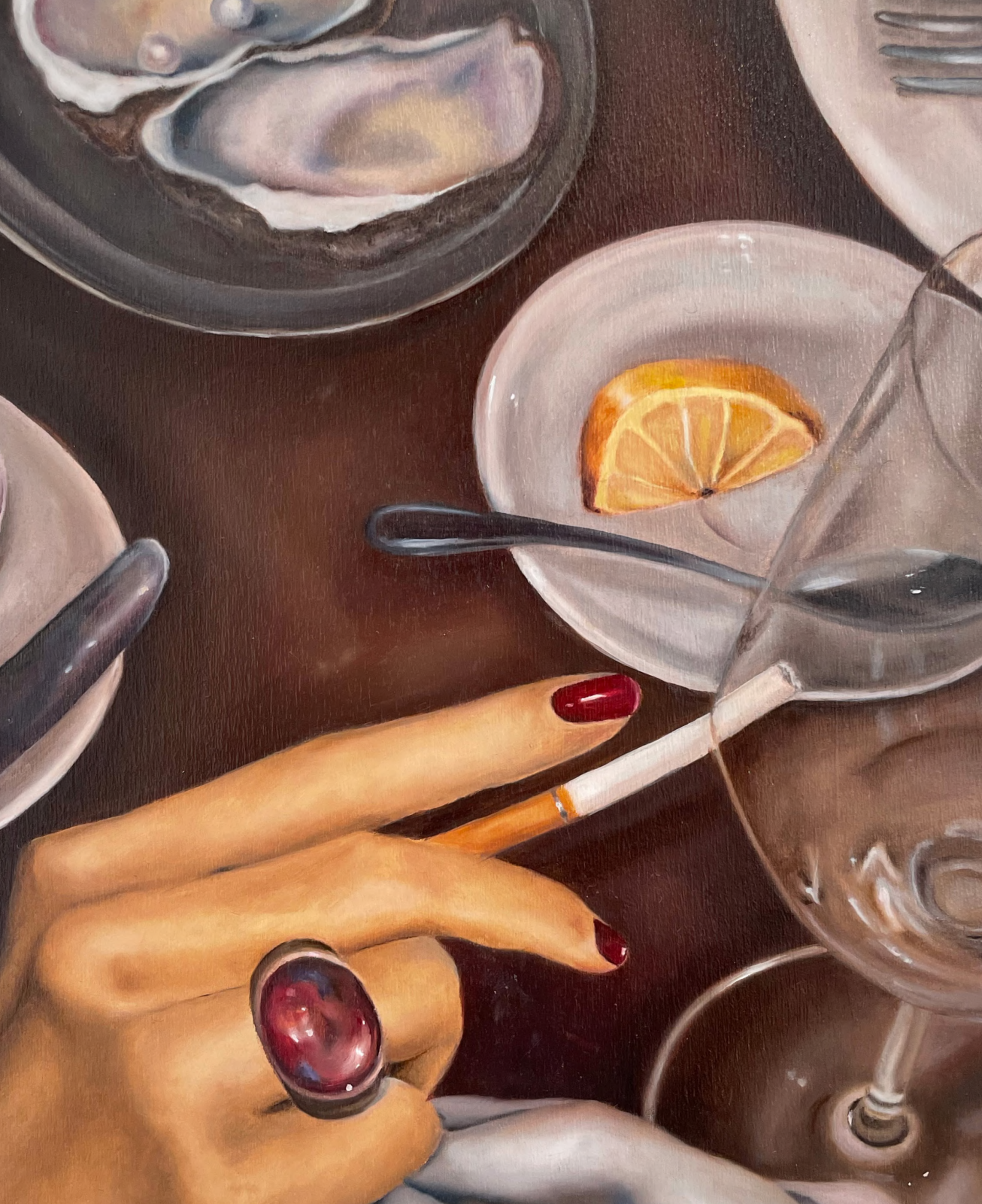
Diner , 2024 Huile sur Bois 19 x 24 cm