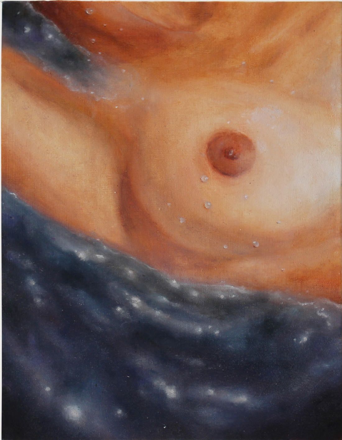
L'Été à Marseille , 2023 Huile sur Bois 14 x 18 cm