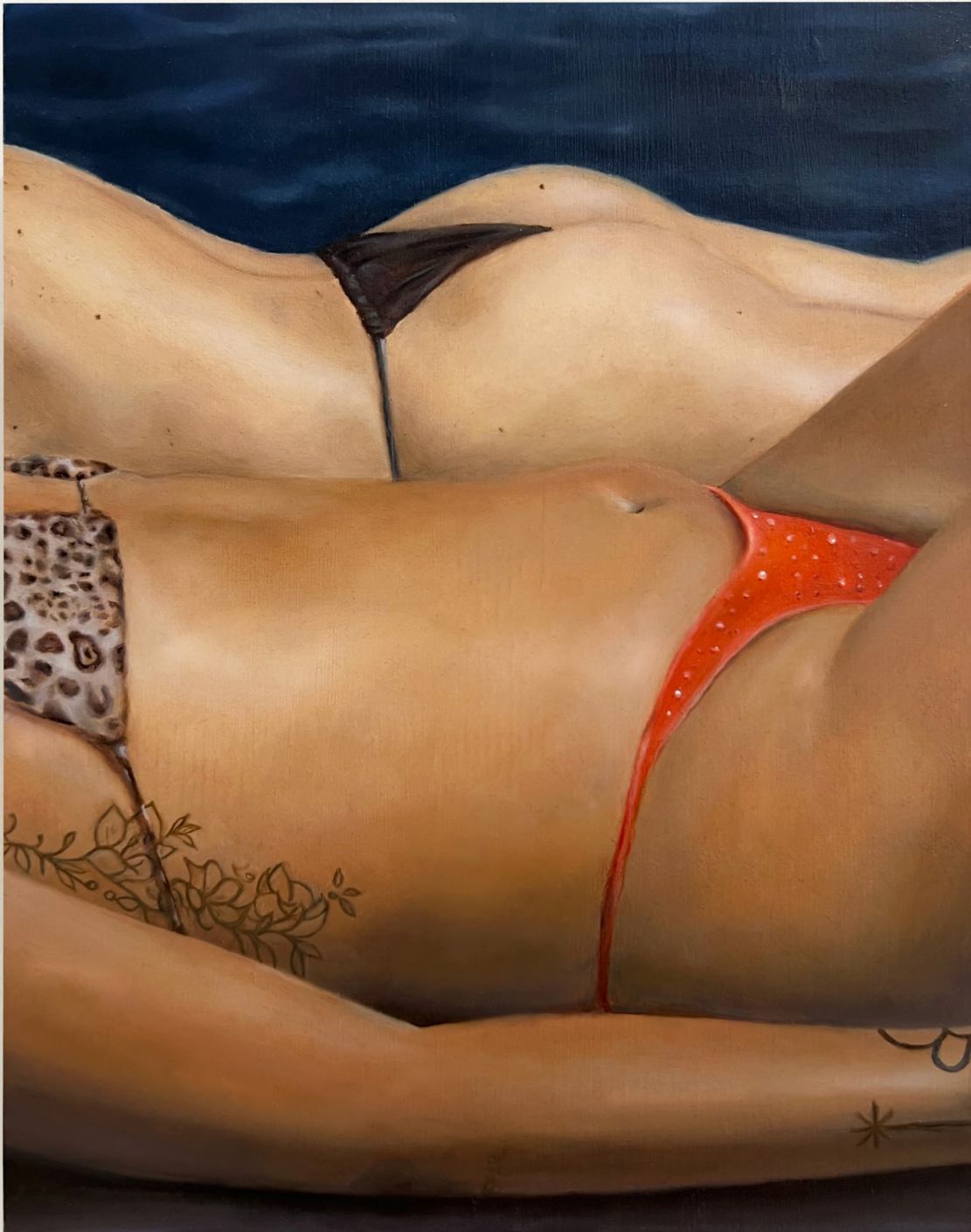
Un été in Marseille , 2023 Huile sur Bois 14 x 18 cm