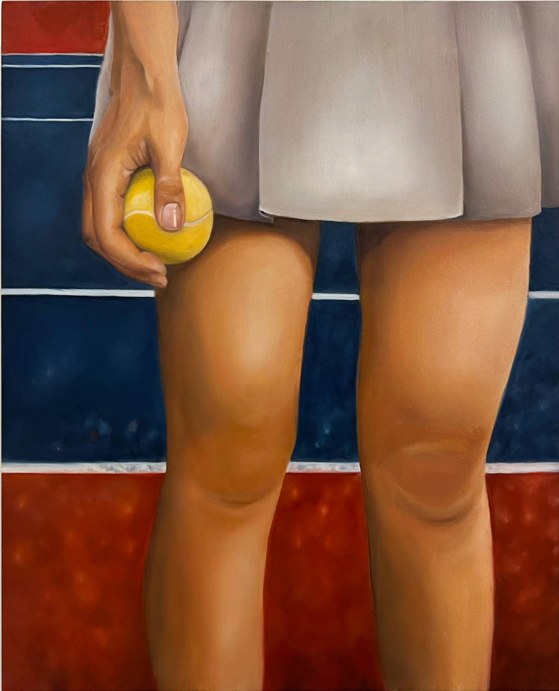
My Youth , 2024 Oil on Wood 33 x 40 cm