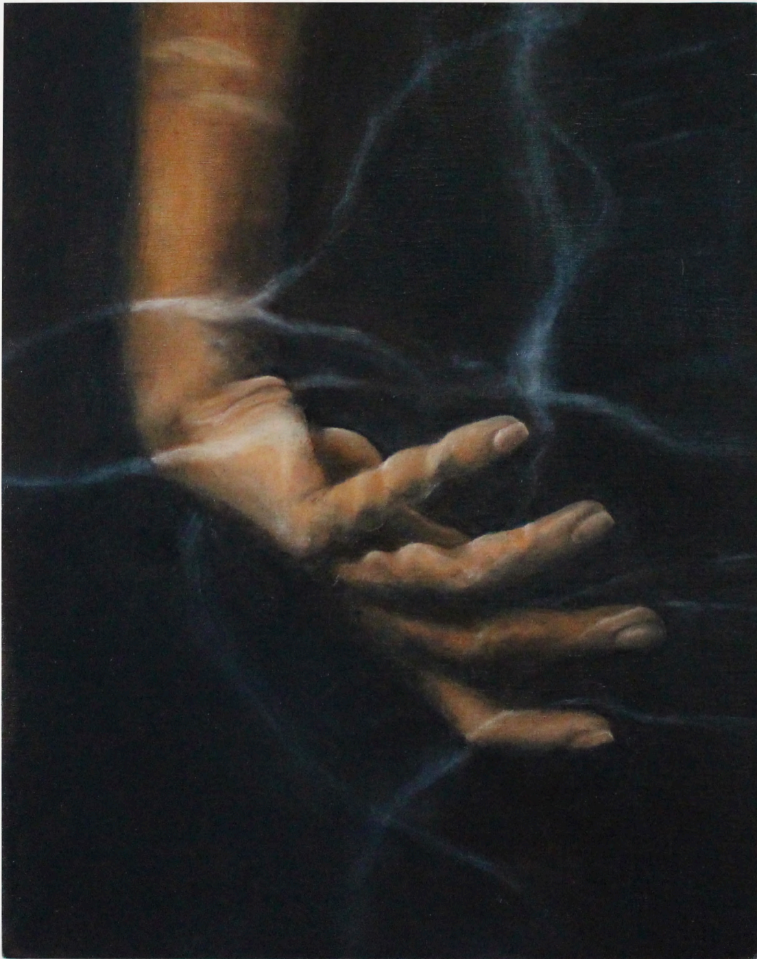
My left hand by my left hand because my right hand is on pause, 2023 Huile sur Bois 19 x 24 cm