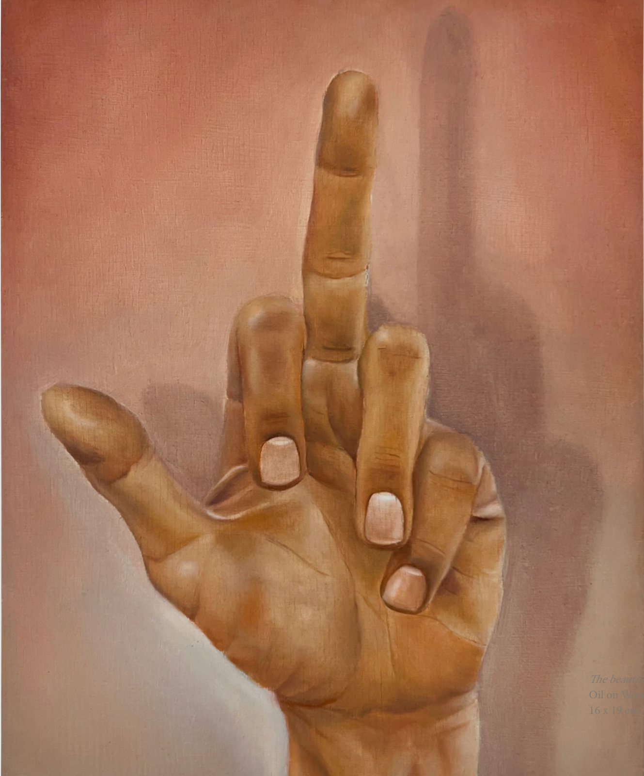
The beautiful hand of Charles, 2023 Oil on Wood 16 x 19 cm