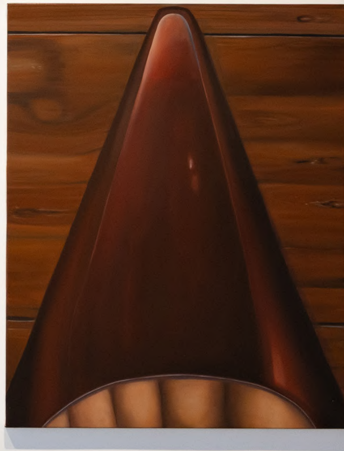
The Shoe Huile sur Toile 65 x 81 cm