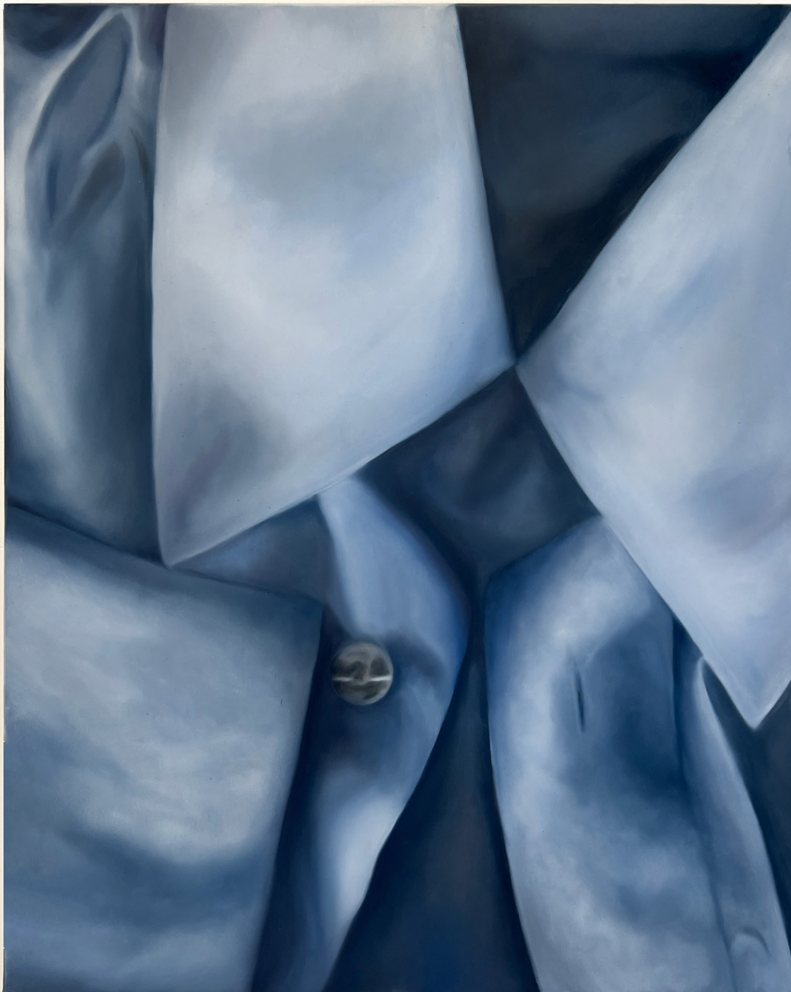
Chemise bleu , 2023 Oil on toile 65 x 81 cm