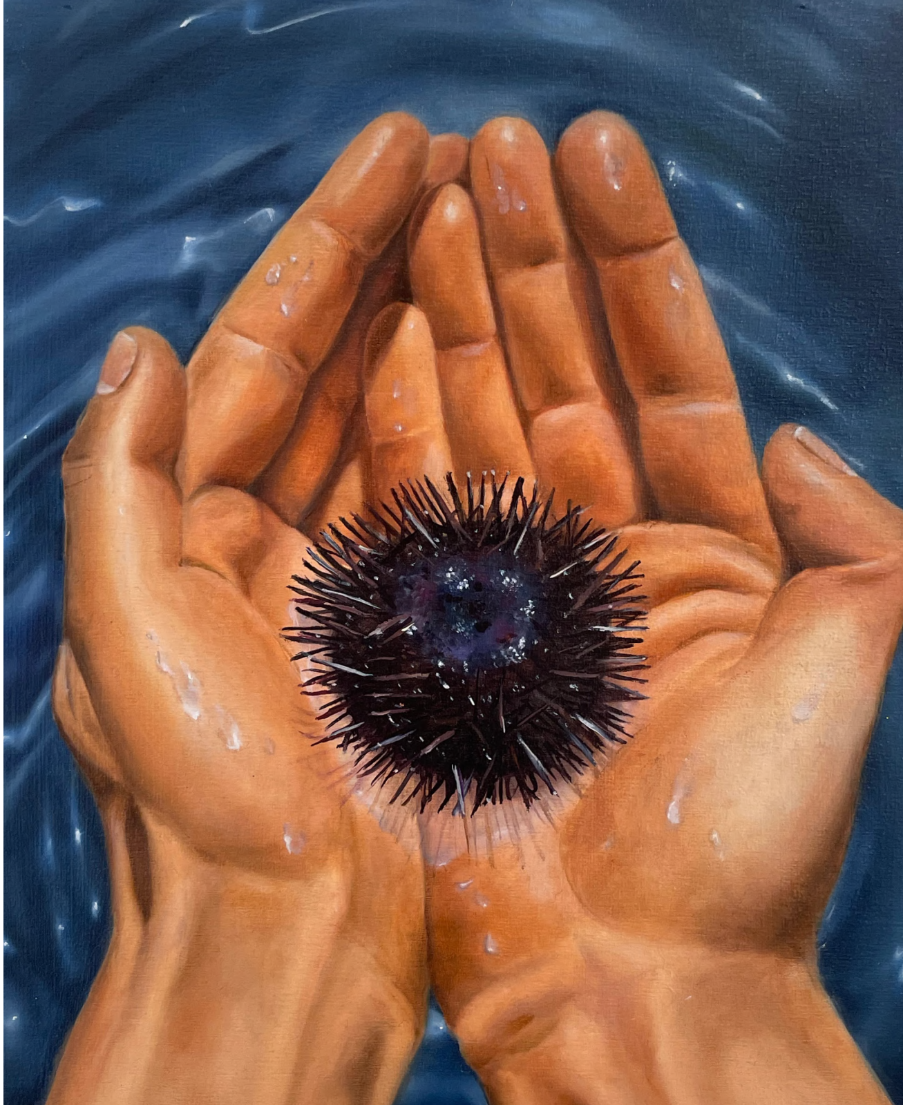
French Sea Urchin , 2024 Huile sur Bois 19 x 24 cm