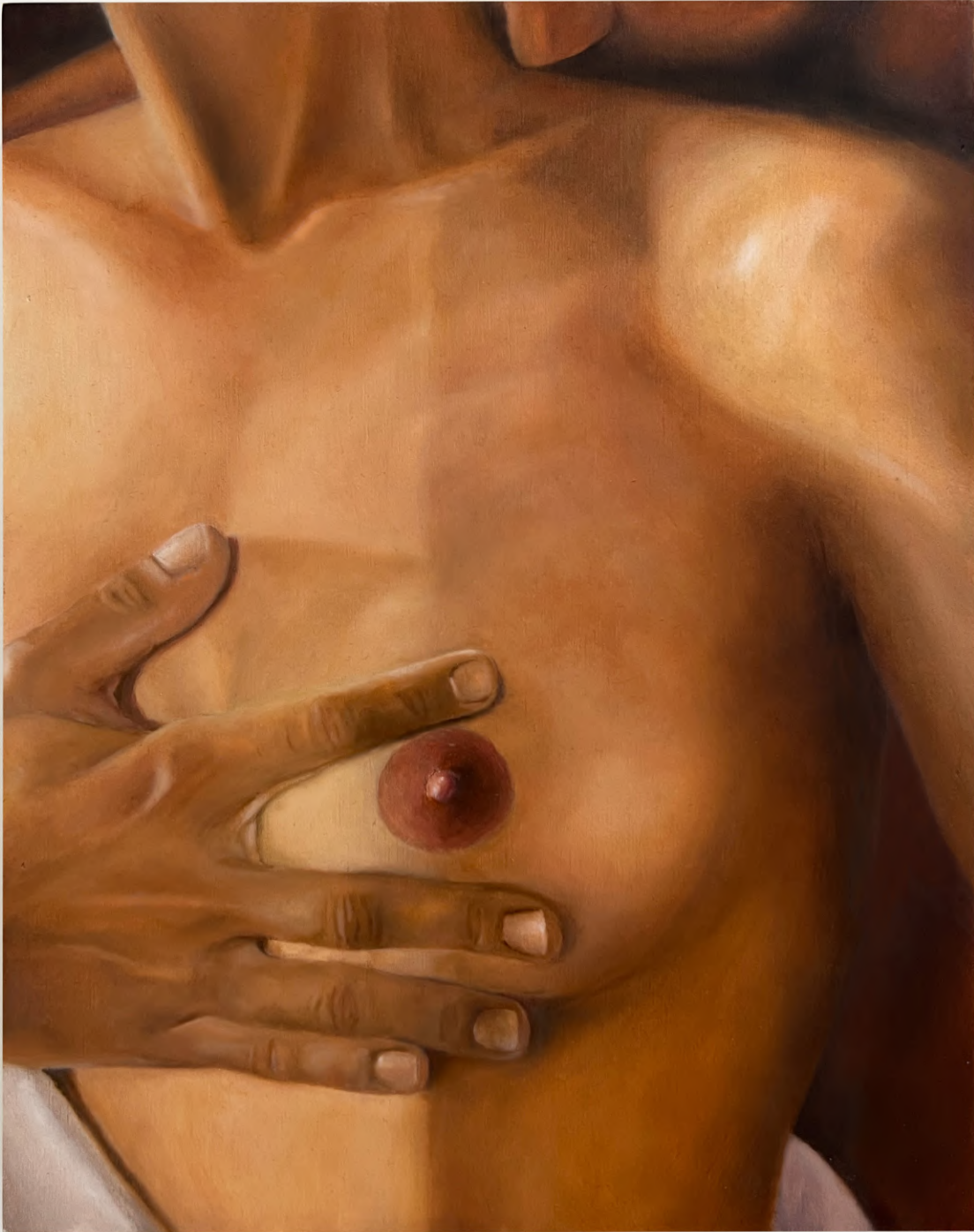
Liefde , 2023 Oil on Wood 19 x 24 cm