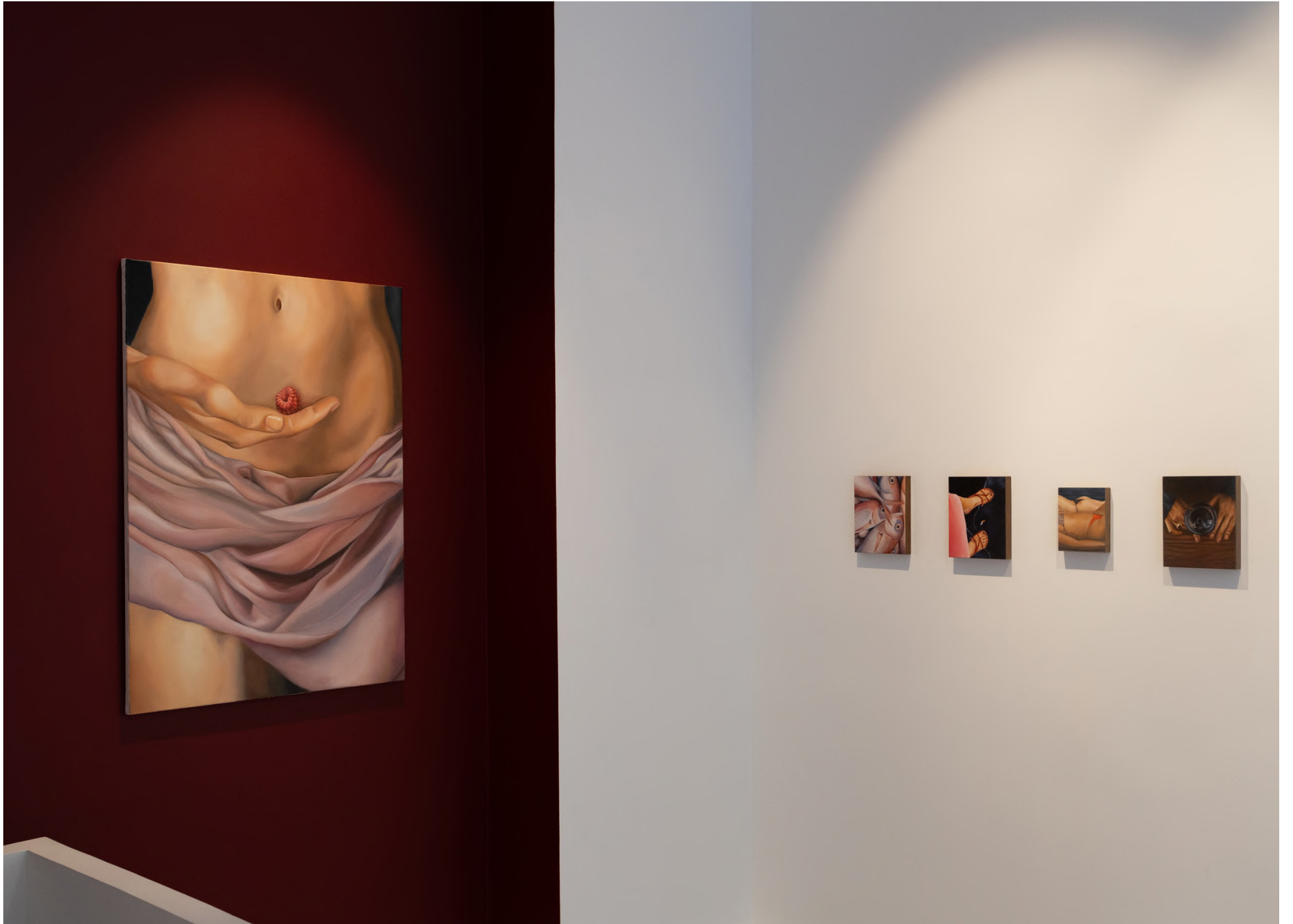
Revenge Dress , Avril 2024, Galerie d'Eylau