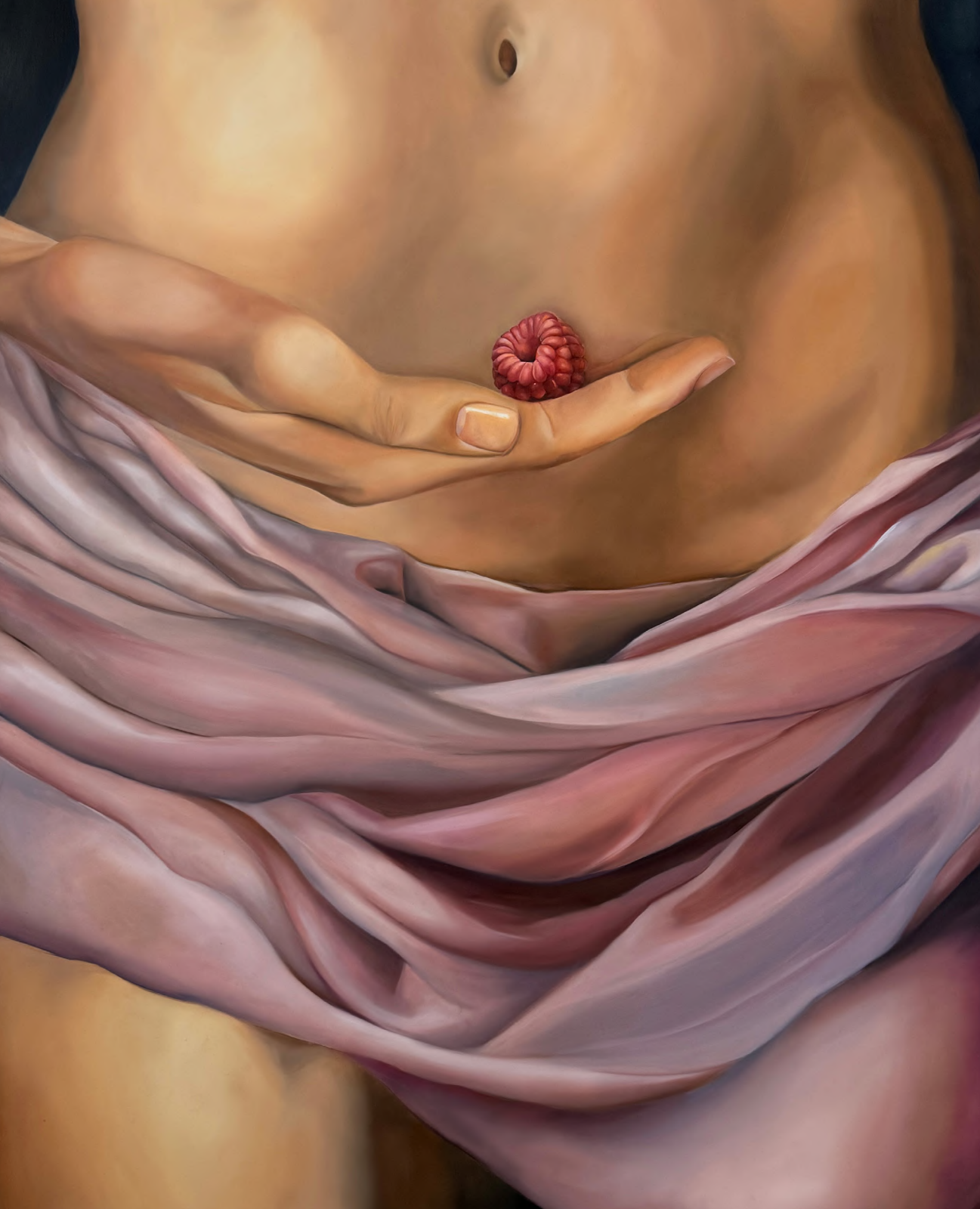
Framboise , 2024 Huile sur Toile 96 x 116 cm