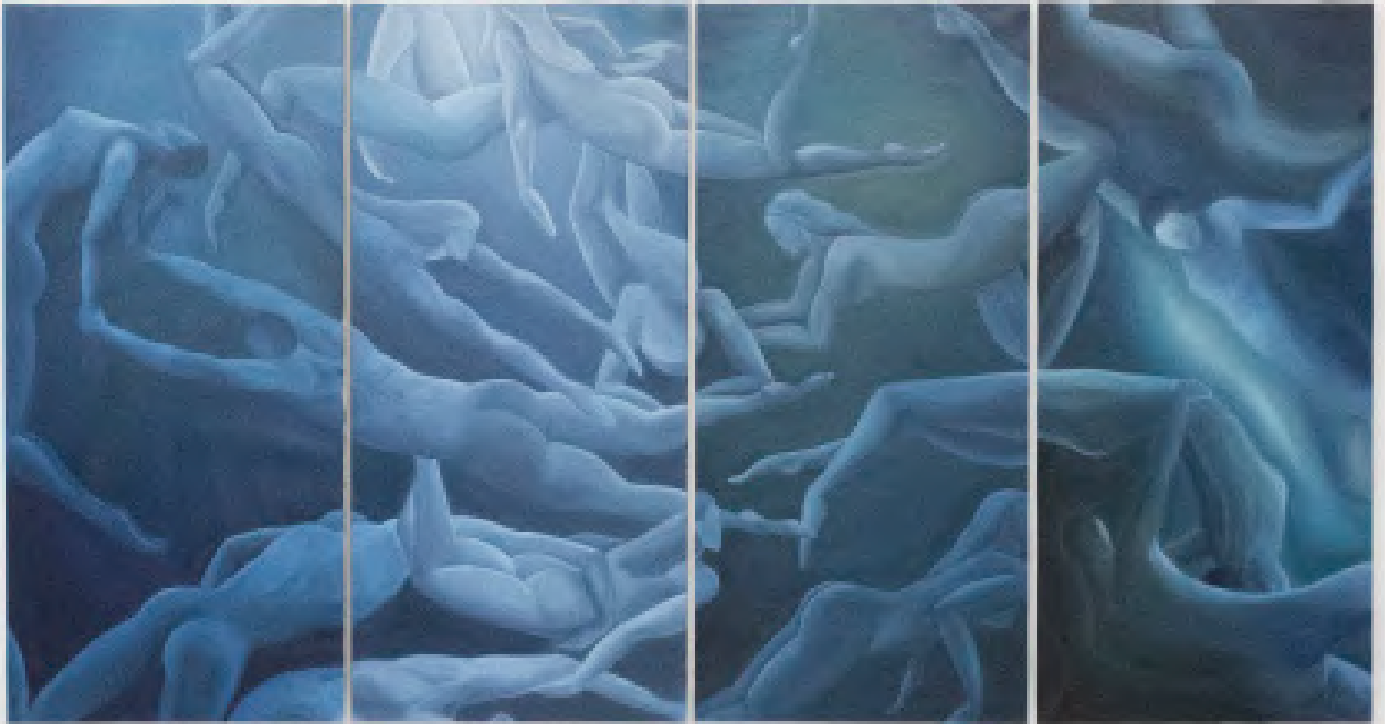
Nageurs , 2022 Huile sur Toile 400 x 200 cm