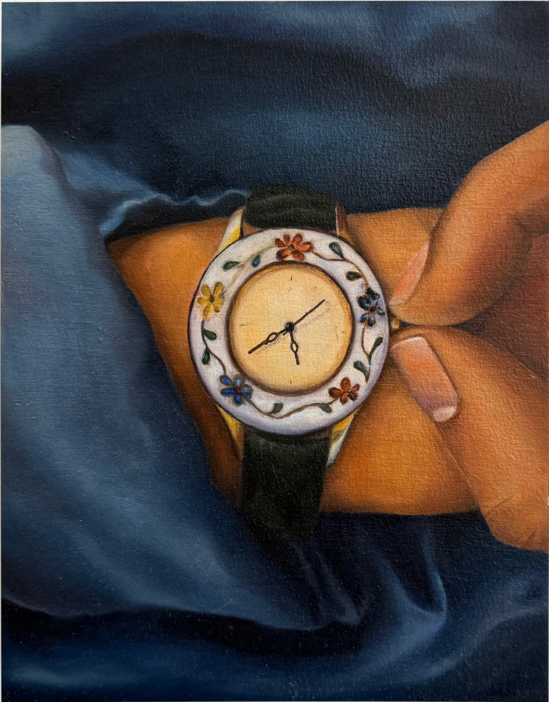
Heritage Horloge , 2024 Huile sur Bois 14 x 18 cm