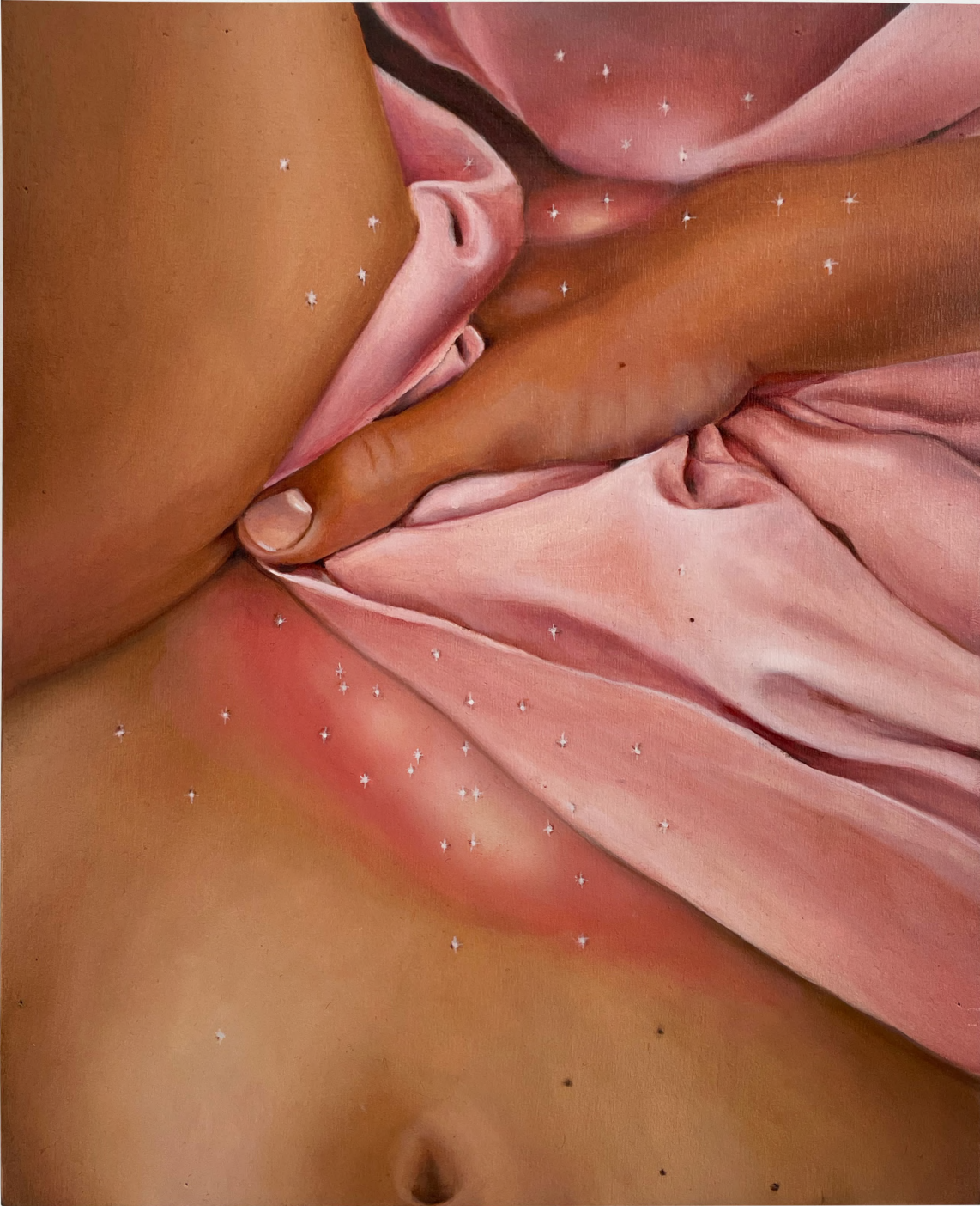
French Touch, 2024 Huile sur Bois 19 x 24 cm